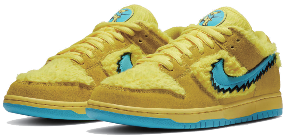
CJ5378-700 OPTI YELLOW/BLUE FURY