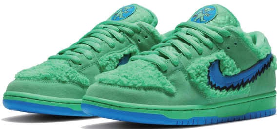
CJ5378-300 GREEN SPARK/SOAR